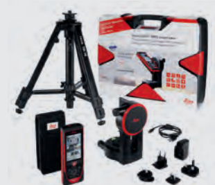
Комплект Leica DISTO™ D810