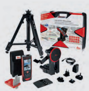
Комплект Leica DISTO™ S910