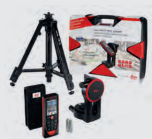
Комплект Leica DISTO™ D510